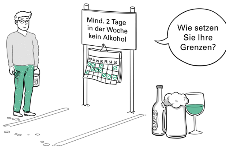
Experten und Expertinnen empfehlen, mindestens zwei Tage in der Woche auf Alkohol zu verzichten.

»Schätzungen gehen davon aus, dass 5 bis 10 % aller Beschäftigten in Unternehmen alkoholkrank sind oder riskant konsumieren.«